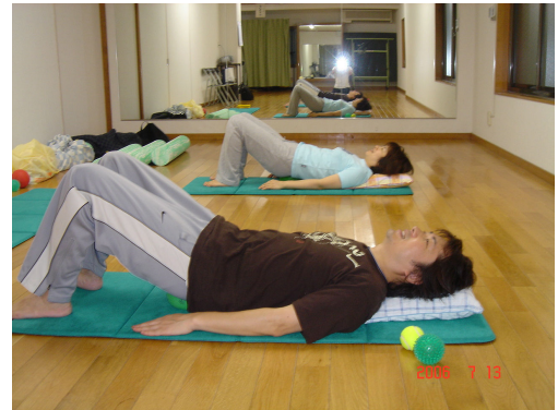
↑マットにこんな風に寝てレッスンします。