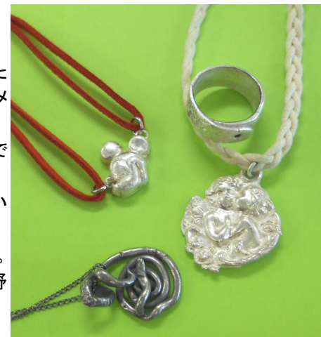
↑生徒さんの作品の一部

年内に製作する作品は先生に決めてもらっています。現在は9人で頑張っています。興味のある方は見学もOKですので、お越し下さいね。詳細については、お気軽に植野までお問い合わせ下さい。