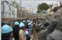
↑ 去年の参加者の様子