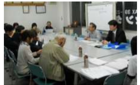
利用者会議の様子(写真) ↑

5月16日(金)にセンター利用者会議を行いました。 参加人数は合計13名で、市民活動センターや市民活動のことについて、意見交換や、今後のセンターのサービスについて話し合いました。 登録団体及び個人の皆様、お忙しい中お越し頂きましてありがとうございました。 今後とも、よろしくお願いいたします。