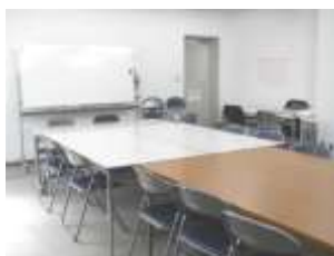
→大会議室 15名程度での 使用可