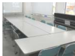
←小会議室 10名程度での 使用可