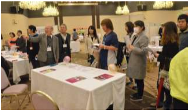
↑写真は過去の会場の様子

また、当日はANAクラウンプラザホテル宇部の組合が「ボランティアズDAY」を同時に開催します。カレーやコーヒーなどの軽食の販売やバザー、災害募金への協力の呼び掛けなどの催しもあります。どなたでも参加できます。興味・関心のある方は、ぜひご参加下さい。交流を図りましょう！