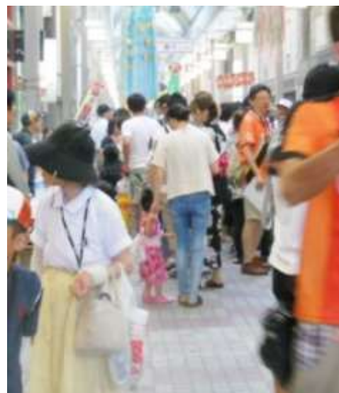
↑写真は過去に開催した土曜夜市の様子です。

今年は花火大会の日のみの開催となりますので、花火と合わせてお楽しみ下さいね。今年もにぎやかな一日になりますように！！